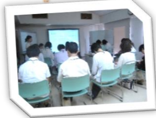
勉強会やミーティングで就労に役立つ知識や情報、マナーを身につけます。