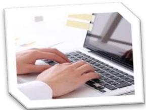
外部講師によるパソコン講習でスキルアップを目指せます。