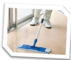
企業や関係機関と提携し、施設外作業、実習に取り組みます。