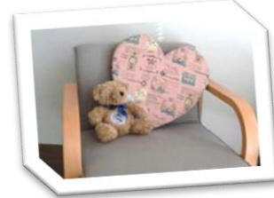
個別面談等で個々の目標の進捗を確認しながら利用できます。