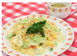
春野菜のクリームパスタ 5月末まで