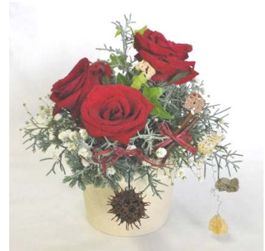
(写真は完成イメージです)