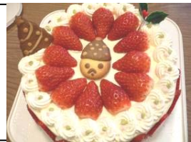
クリスマスケーキ

畑で収穫したさつまいも、かぼちゃは裏ごしをした後、味付けをし、オーブンで焼きました。どちらも立派なスイーツに仕上がりました。この秋、ひと口いかがですか？