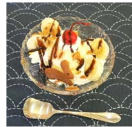
アイスサンデー (チョコ)→