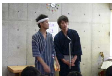
↑ メンズサタデーズ

昨年に引き続き、サタデーピアの会員の皆様や夢工房 if の常連さん、ご近所の方などたくさんの方にお越しいただき、総勢 100 名以上のご参加がありました。彦根ファミリー山の会の皆様を始め、多くの方々にご協力いただき、今年一番の夏の思い出ができました。どうもありがとうございました。来年もぜひお楽しみに！ (コーヒー牛乳)