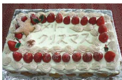
↑スペシャルクリスマスケーキ

昨年12月16日(土)に、「夢工房 if」でサタデーピア クリスマスイベントを開催しました。総勢27名の方がご参加くださいました。